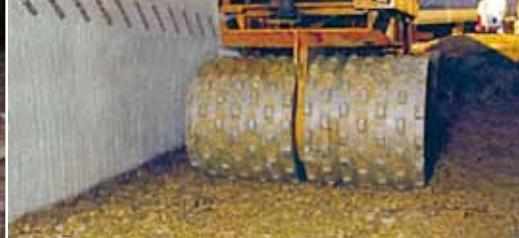
Высокая прочность на сжатие, даже при высоких нагрузках.