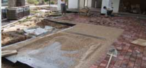
Дренажный слой для мощения.