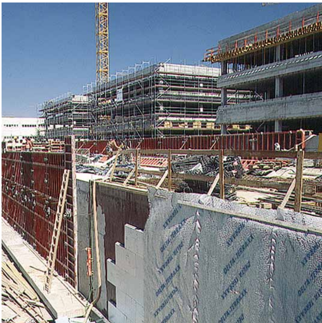
DELTA®-TERRAXX применяется на самых ответственных объектах.