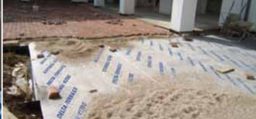
Дренажный слой для мощения.