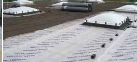
Дренаж и защита для зелёных крыш.