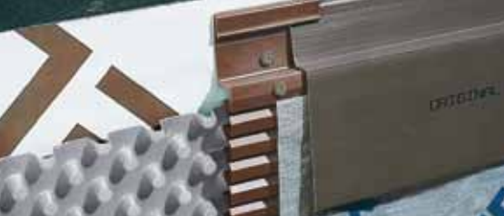
Защитная планка и крепёжная скоба DELTA®.